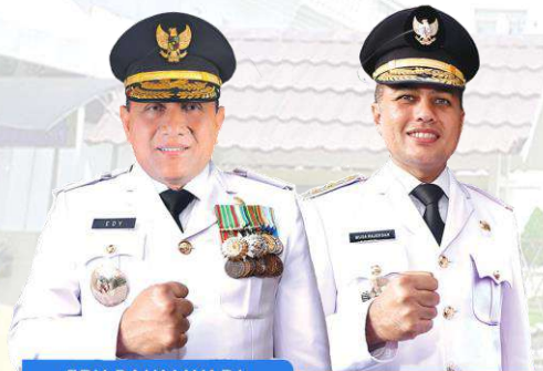
EDY RAHMAYADI Gubernur Sumatera Utara

ANGGARAN SESUAI DENGAN PERGUBSU NO. 16 TAHUN 2022 SAMPAI DENGAN SAMPAI DENGAN 16 JUNI 2022