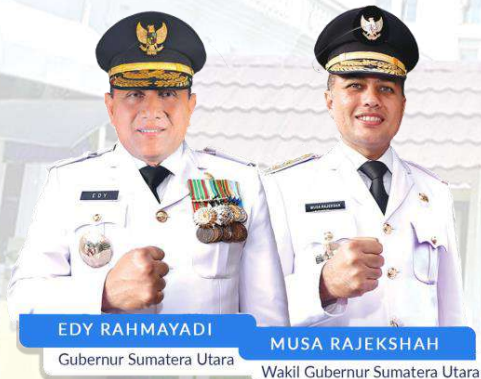
EDY RAHMAYADI Gubernur Sumatera Utara